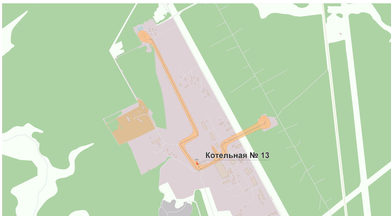
Рисунок 2. Существующие зоны действия теплоснабжения источников тепловой энергии на территории г.п. Советский

Перспективные зоны действия теплоснабжения источников тепловой энергии на территории г.п. Советский представлены на рисунке 3.