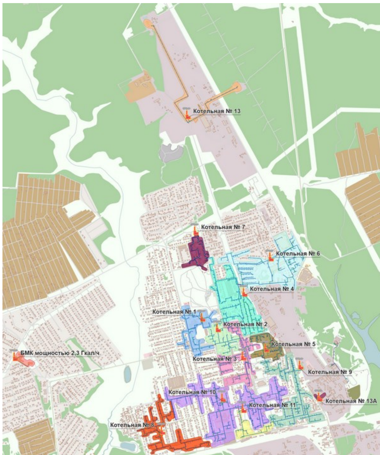
Рисунок 3. Перспективные зоны действия теплоснабжения источников тепловой энергии на территории г.п. Советский